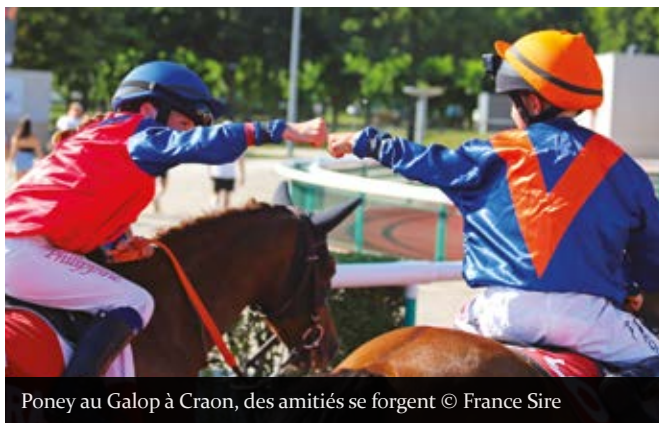
Poney au Galop à Craon, des amitiés se forgent