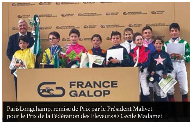
ParisLongchamp, remise de Prix par le Président Malivet pour le Prix de la Fédération des Eleveurs