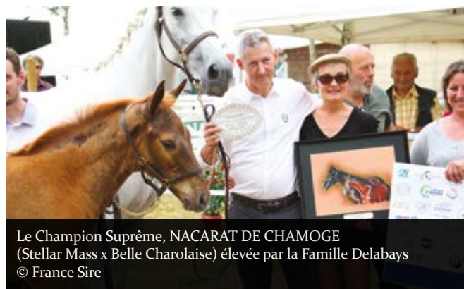
Le Champion Suprême, NACARAT DE CHAMOGE (Stellar Mass x Belle Charolaise) élevée par la Famille Delabays

La Fédération des Eleveurs du Galop et l'Associations des Eleveurs de chevaux de Sang du Centre-Est soutiennent ces événements qui sont nécessaires et répondent aux besoins des éleveurs.