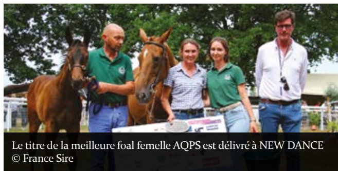
Le titre de la meilleure foal femelle AQPS est délivré à NEW DANCE