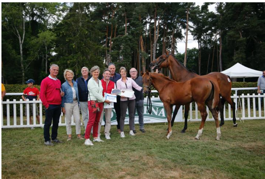
Prix de la Fédération des Éleveurs du Galop (meilleur couple foal/jument)